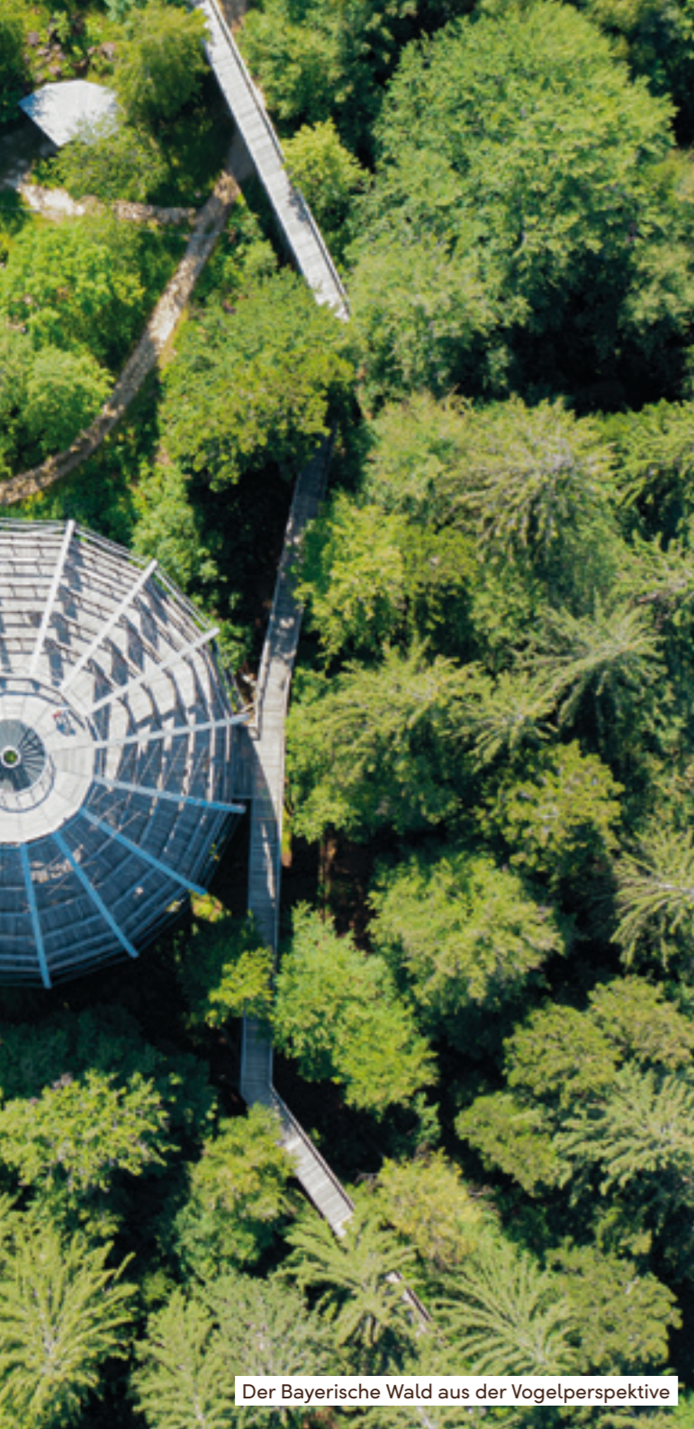
Der Bayerische Wald aus der Vogelperspektive