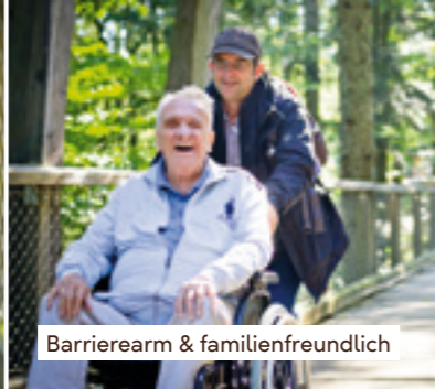
Barrierearm & familienfreundlich