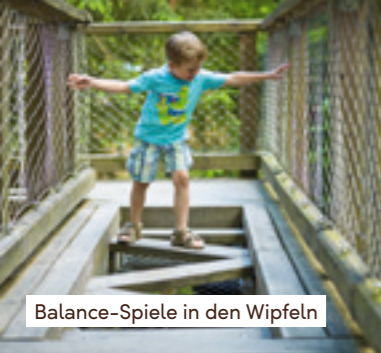
Balance-Spiele in den Wipfeln