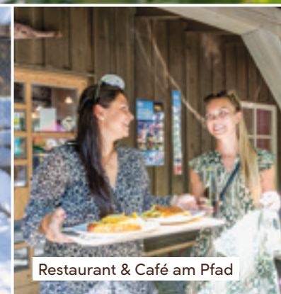
Restaurant & Café am Pfad