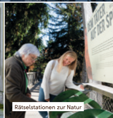
Rätselstationen zur Natur