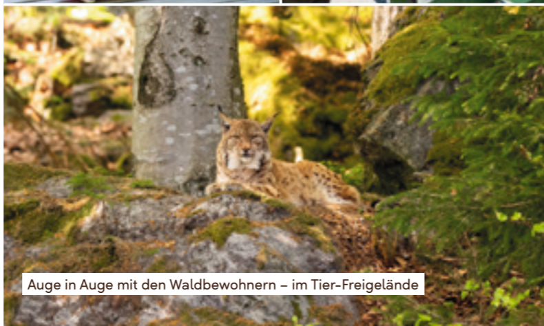
Auge in Auge mit den Waldbewohnern – im Tier-Freigelände