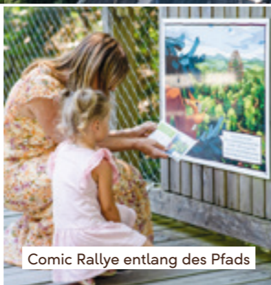
Comic Rallye entlang des Pfads

Tickets gibt es direkt am Eingang des Baumwipfelpfads, aber auch online auf unserer Website. Ihr möchtet gemeinsame Zeit und ein unvergessliches Erlebnis verschenken? Auf unserer Website sind Geschenk-Gutscheine schnell und unkompliziert bestellt – und ihr habt sie noch am selben Tag parat.