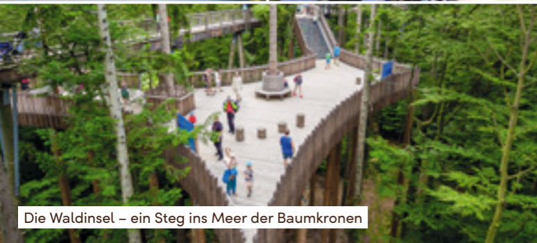
Die Waldinsel – ein Steg ins Meer der Baumkronen