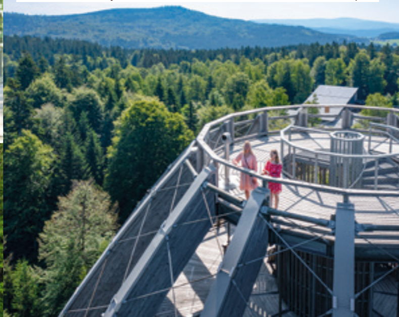
Blick über den Bayerischen Wald, Rachel und Lusen bis zu den Alpen