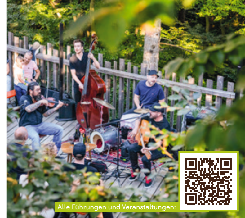
Alle Führungen und Veranstaltungen:

Die Waldwildnis des Nationalparks Bayerischer Wald entdecken – das geht im Nationalparkzentrum Lusen, in dem auch der Baumwipfelpfad zu finden ist. Direkt am Pfad sind die Waldbewohner im Tier-Freigelände hautnah erlebbar. Das Besucherzentrum Hans-Eisenmann-Haus mit interaktiven Ausstellungen, Infos zum Lebensraum Wald sowie Indoor-Kletterberg für Kinder rundet den Ausflug ab. www.nationalpark-bayerischer-wald.bayern.de