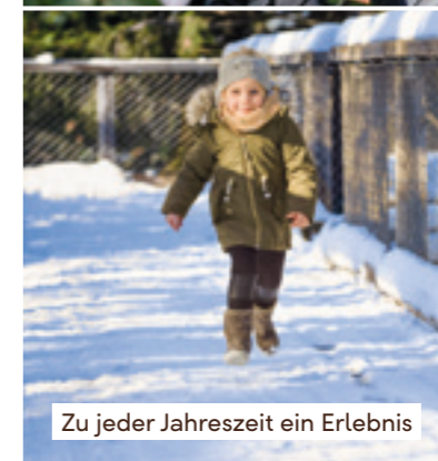
Zu jeder Jahreszeit ein Erlebnis